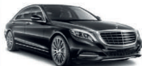
MERCEDES S CLASS