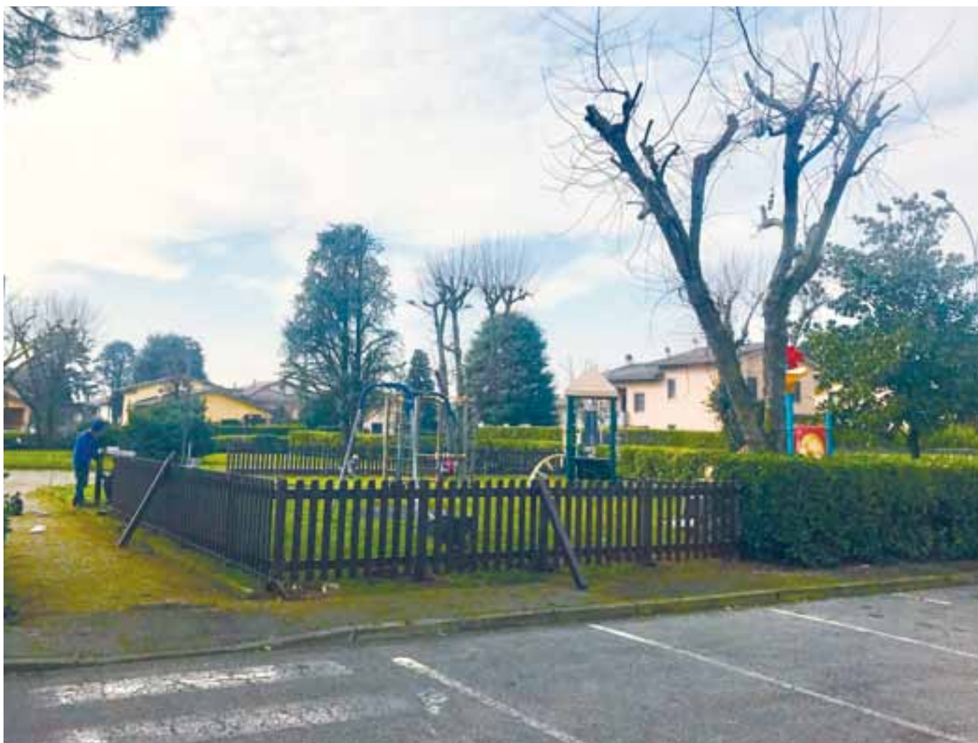
Parco via Matteotti