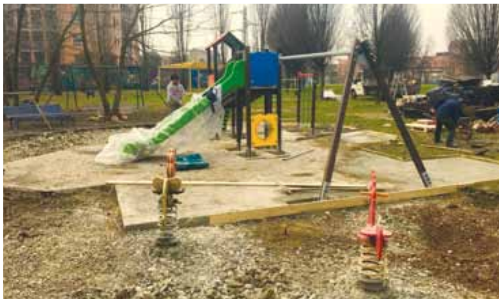
Parco via Martiri della Libertà