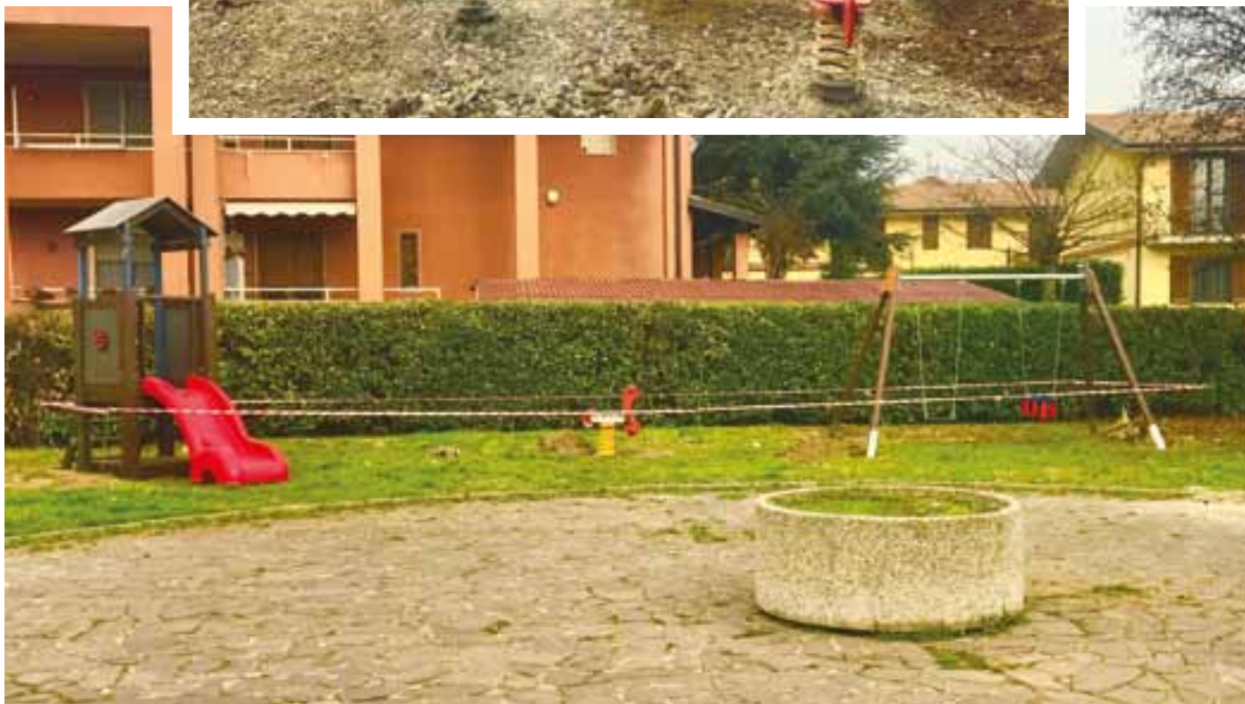
Parco delle Costellazioni